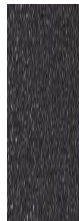
그래파이트 그레이 메탈릭 (P7V)