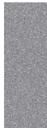
쉬머링 실버 메탈릭 (R2T)