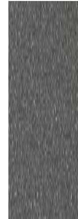
올리바인 그레이 메탈릭 (X5R)