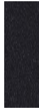
문라이트 블루 펄 (UB7)