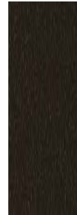
가야아 브라운 펄 (D2S)